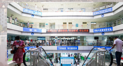
让车位于患者、让诊室于患者、共享轮椅、无假日专家门诊、无假日体检、上门体检、志愿服务等便民举措温暖人心。