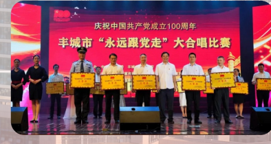
我院在全市乃至全省庆祝建党100周年系列活动中均获得优异成绩。