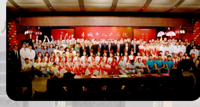
庆祝建院90周年，我院举办院歌征集、院志修订、文艺汇演、书画作品展、歌咏比赛、知识竞赛等活动。