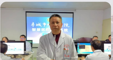
2021年12月29日，丰城市人民医院智慧医院信息系统正式上线！