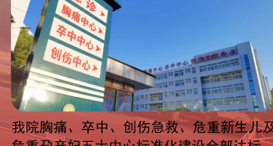
我院胸痛、卒中、创伤急救、危重新生儿及危重孕产妇五大中心标准化建设全部达标。