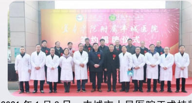
2021年1月8日，丰城市人民医院正式挂牌宜春学院附属丰城医院，迈出医教研一体化综合医院的关键一步。