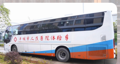
2021年12月21日，我院第一台大型移动健康体检车正式启用，把“一站式”健康体检服务直接“搬”到家门口。