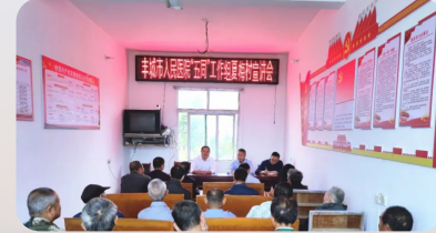
与夏梅村、上岩村23户帮扶对象完成对接，推进巩固脱贫攻坚成果同乡村振兴有效衔接。