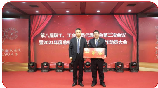
神经外科荣获新技术项目一等奖