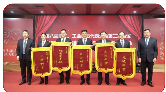
医政管理支部获选2021年度优秀党支部，普外二科、内分泌科、病理科、党政办获评2021年度综合目标管理先进科室