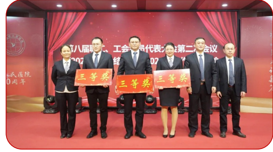
普外二科、骨科脊柱病区、心胸/血管综合介入科荣获新技术项目三等奖