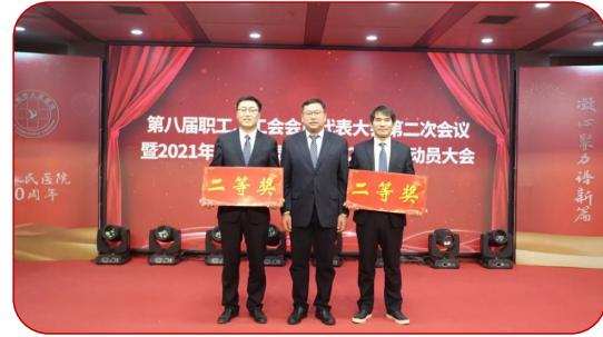
神经内科一病区、骨科脊柱病区荣获新技术项目二等奖